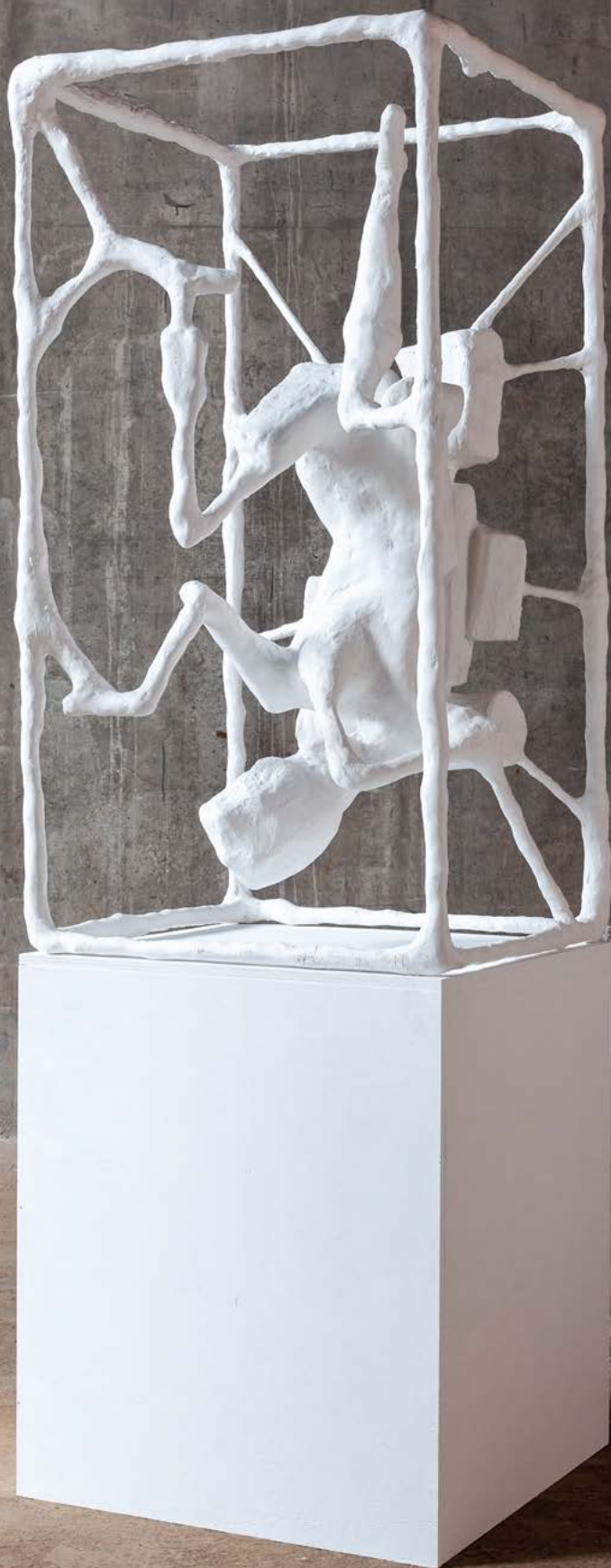
Atelier Van Lieshout, Fallen Warrior 2023, modèle en plâtre, l 74 x L 74 x h 145 cm (sans piédestal), Atelier Van Lieshout, Fallen Warrior , 2023, plâster model, l 74 x L 74 x h 145 cm (ex piédestal),