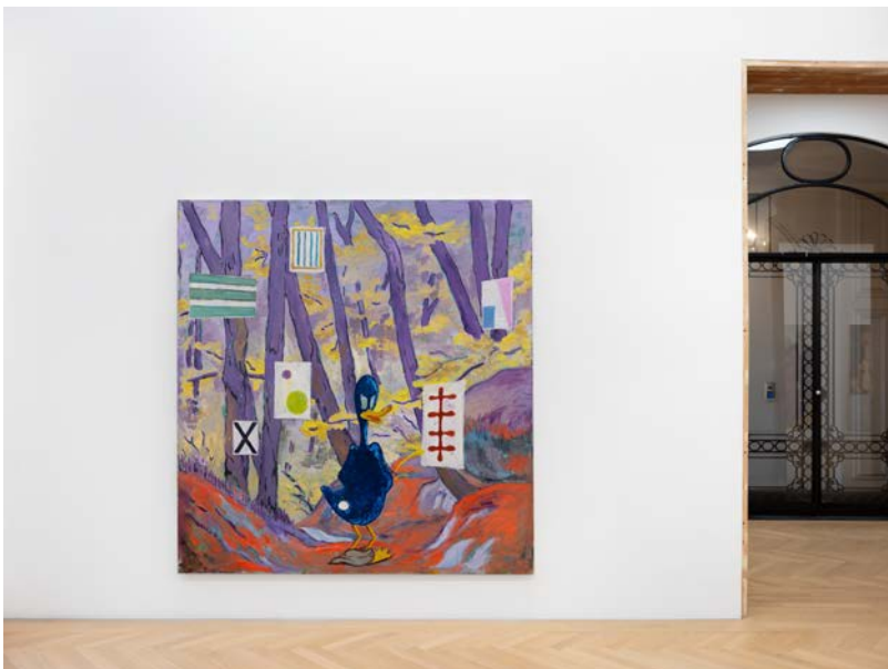
In Search of the Ridiculous Exhibition View Nosbaum Reding, Brussels, 2025