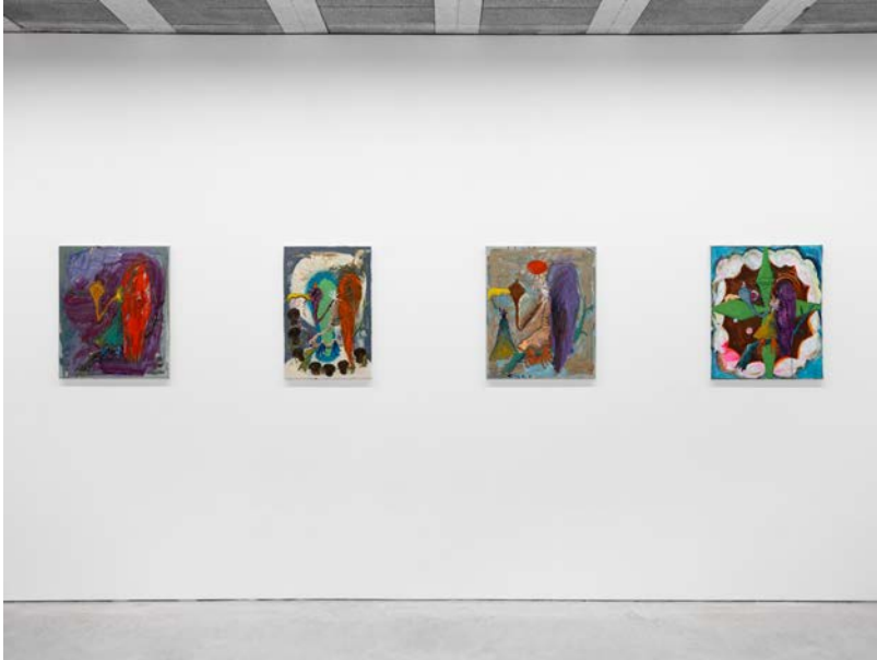
In Search of the Ridiculous Exhibition View Nosbaum Reding, Brussels, 2025