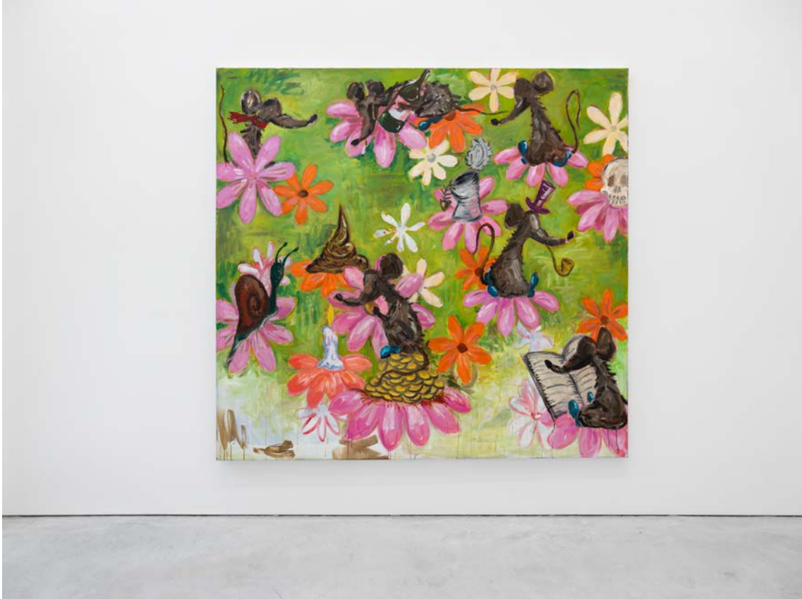
In Search of the Ridiculous Exhibition View Nosbaum Reding, Brussels, 2025

Gallery Nosbaum Reding 60, rue de la Concorde, 1050 Bruxelles / T (+32) 24 11 11 85 / contact@nosbaumreding.com