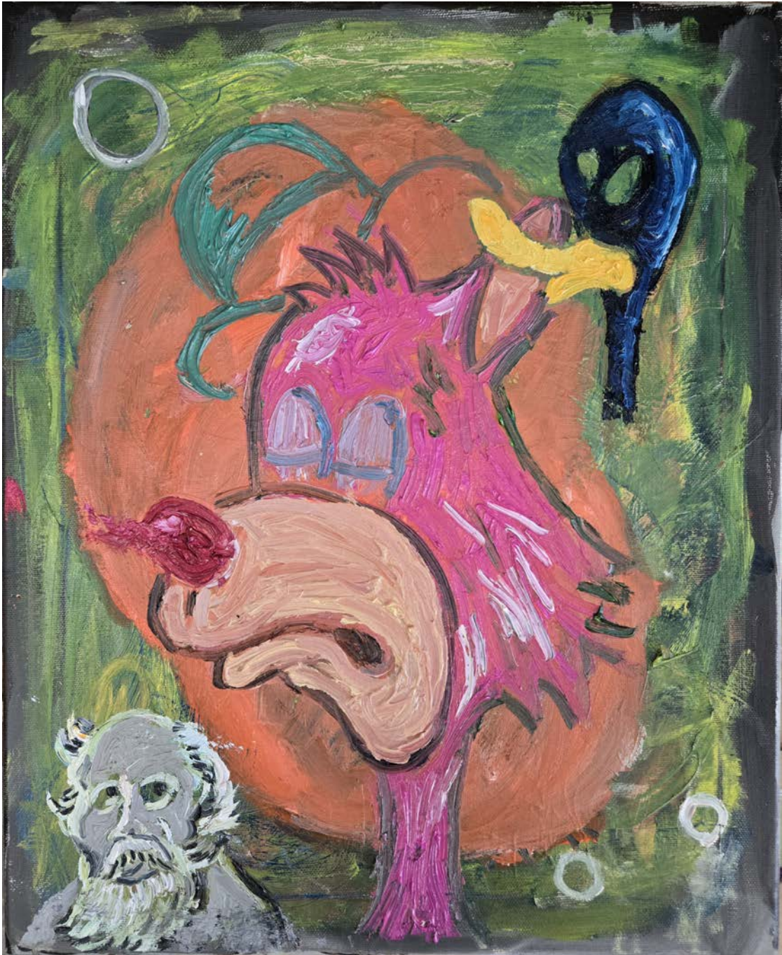
The Phantoms of Meisenthal 5, 2024 oil on canvas 19.69 x 19.69 in ( 50 x 40 cm )