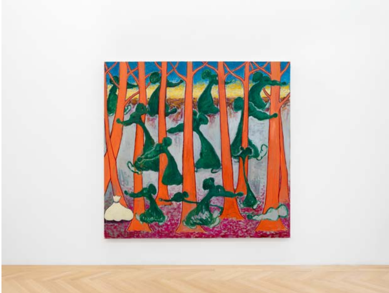
In Search of the Ridiculous Exhibition View Nosbaum Reding, Brussels, 2025