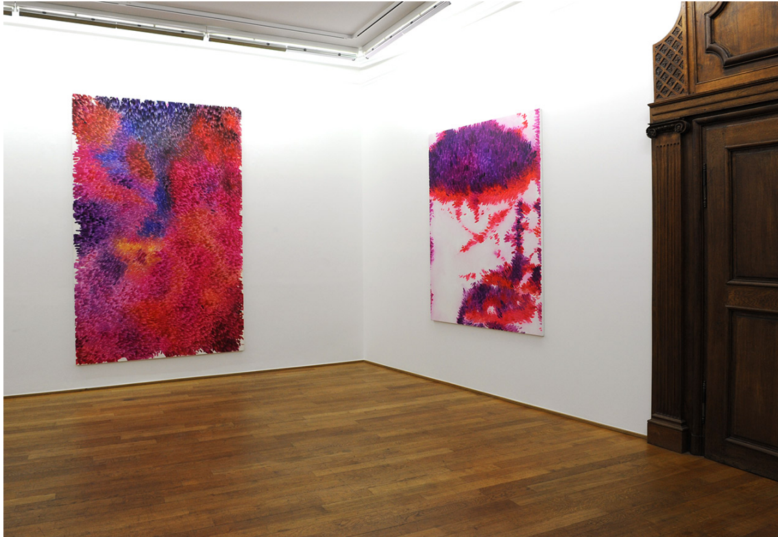
Exhibition View Nosbaum Reding, Luxembourg, 2016