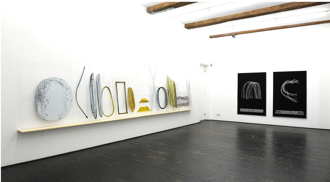
L'état des choses Exhibition View Nosbaum Reding, Luxembourg, 2016