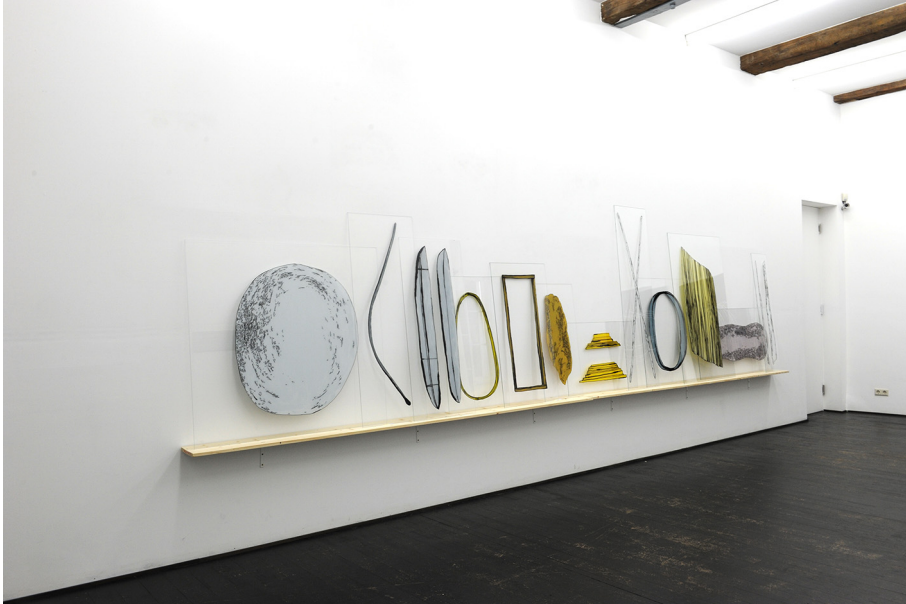
L'état des choses Exhibition View Nosbaum Reding, Luxembourg, 2016