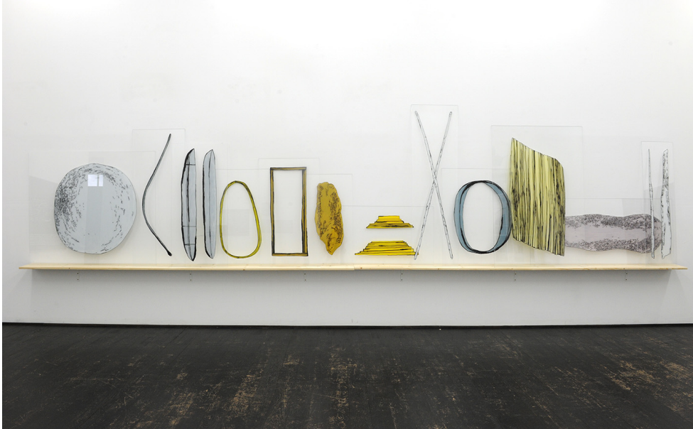
L'état des choses Exhibition View Nosbaum Reding, Luxembourg, 2016