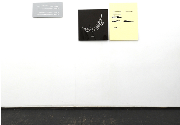
L'état des choses Exhibition View Nosbaum Reding, Luxembourg, 2016