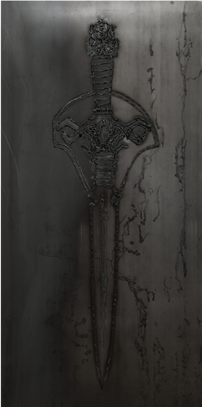
Gate of Darkness , 2017 Steel, varnish 150 x 75 cm