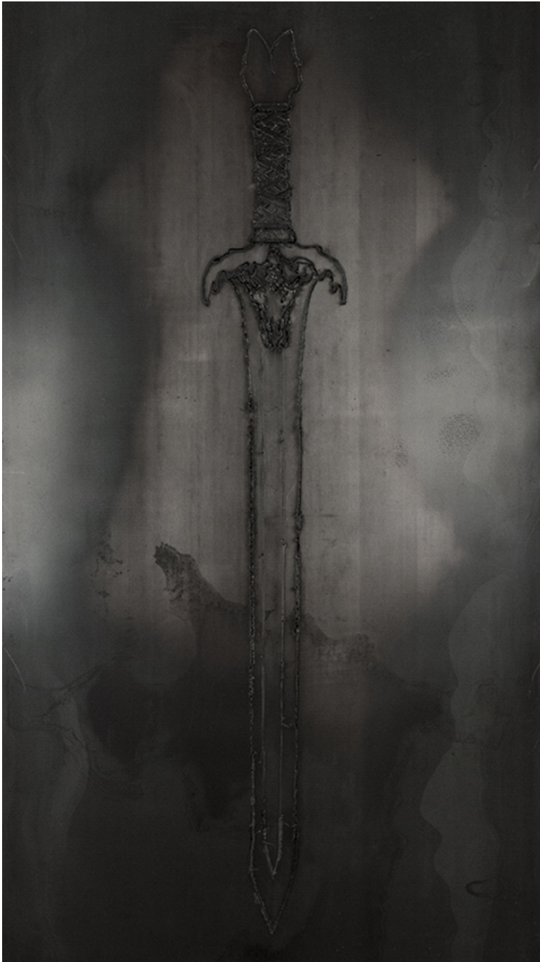
Master's Sword , 2017 Steel, varnish 270 x 150 cm