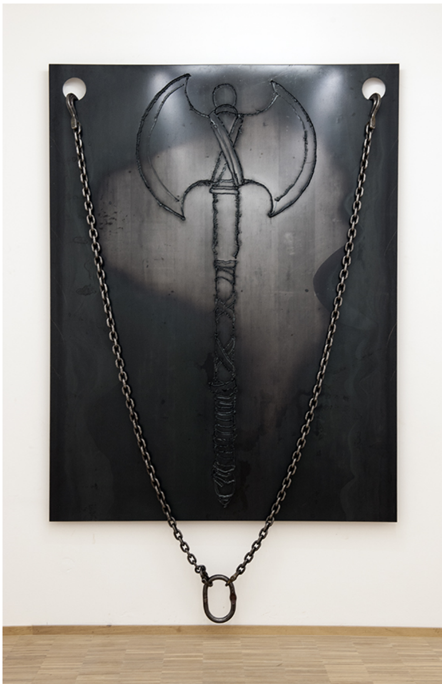
Crush your enemies , 2017 Steel, varnish 200 x 150 cm