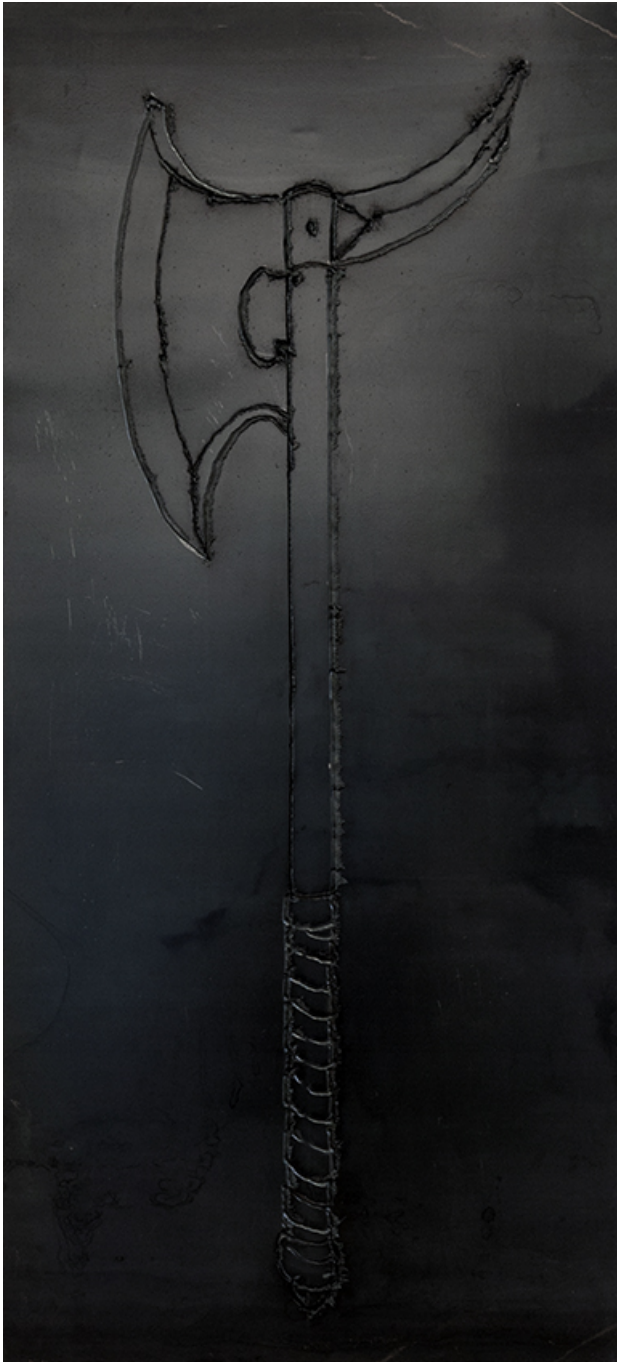
By this axe I rule , 2017 Steel, varnish 150 x 70 cm