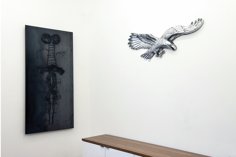
Xavier Mary Exhibition View Nosbaum Reding, Luxembourg, 2017