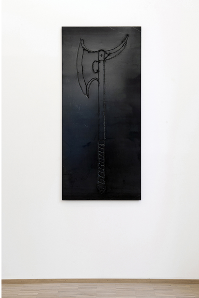
Xavier Mary Exhibition View Nosbaum Reding, Luxembourg, 2017