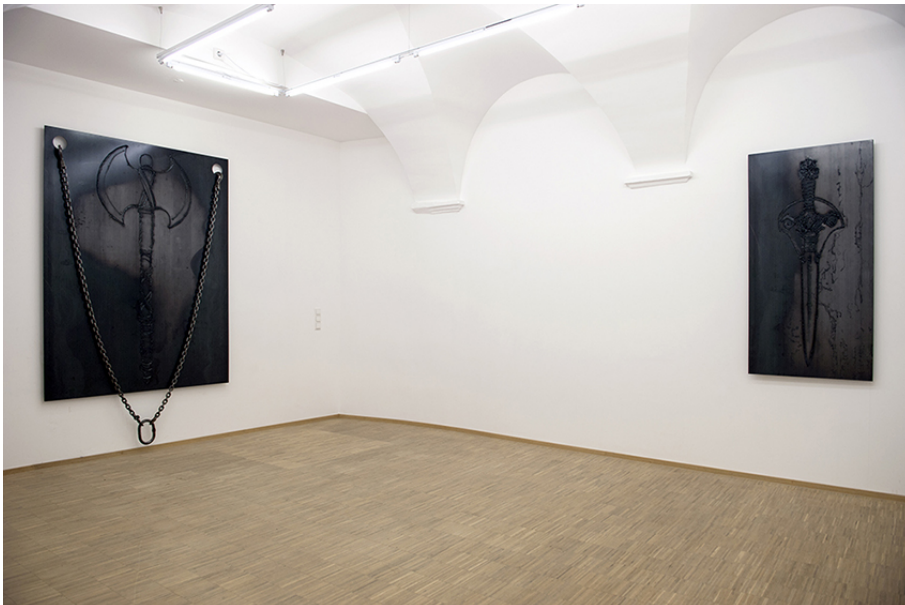
Xavier Mary Exhibition View Nosbaum Reding, Luxembourg, 2017