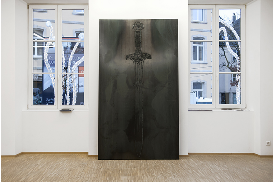
Xavier Mary Exhibition View Nosbaum Reding, Luxembourg, 2017