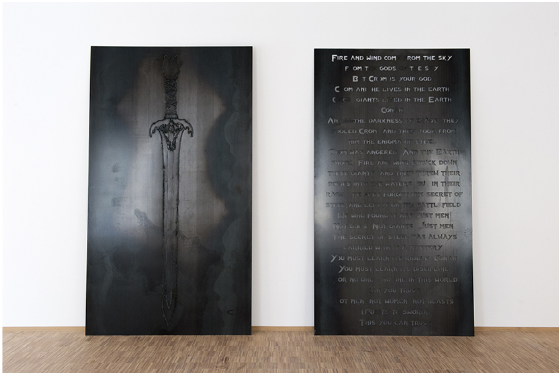
Xavier Mary Exhibition View Nosbaum Reding, Luxembourg, 2017