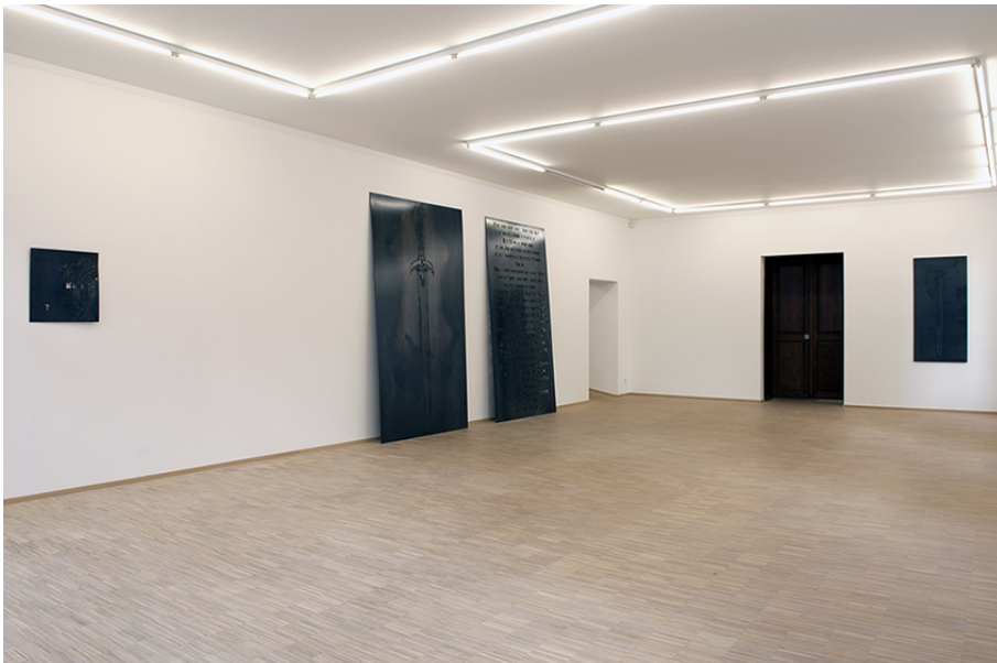
Xavier Mary Exhibition View Nosbaum Reding, Luxembourg, 2017