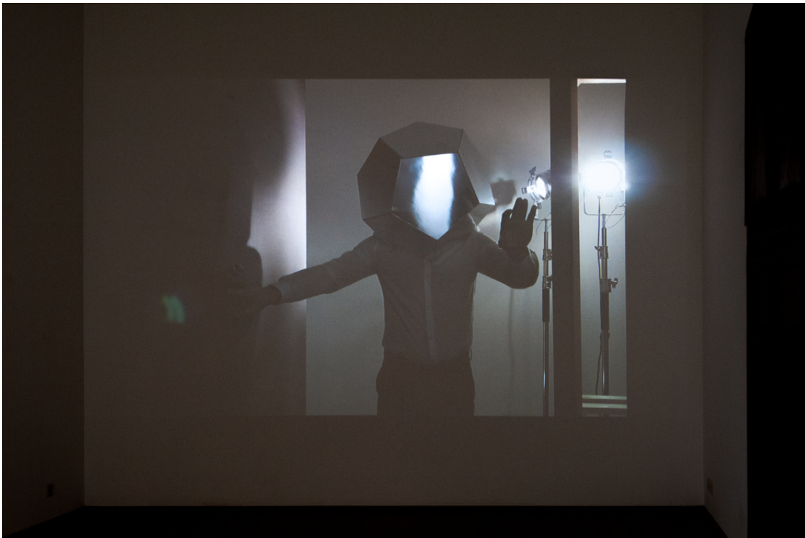
L'espace de Monsieur Polyèdre , 2019 Vidéo full HD 6:59 min, muet Edition of 3 ex + 1 EA