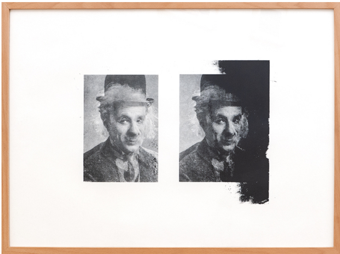
Titre oublié , 2016 Serigraph 20.47 x 28.35 in ( 52,5 x 72,5 cm ) Edition of 7 ex