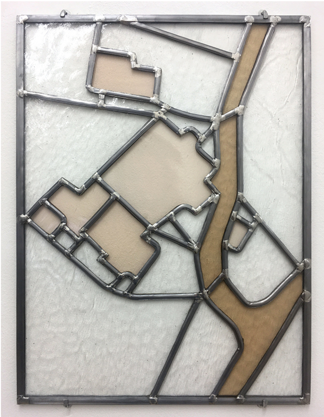
Parcelle 38-48, Le Lame , 2019 Vitrail (verre, zinc, plomb) 16.14 x 12.2 in ( 41,8 x 31 cm )