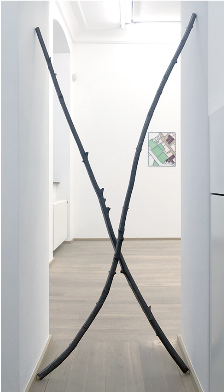
Claire-voie , 2020 Fonte de fer