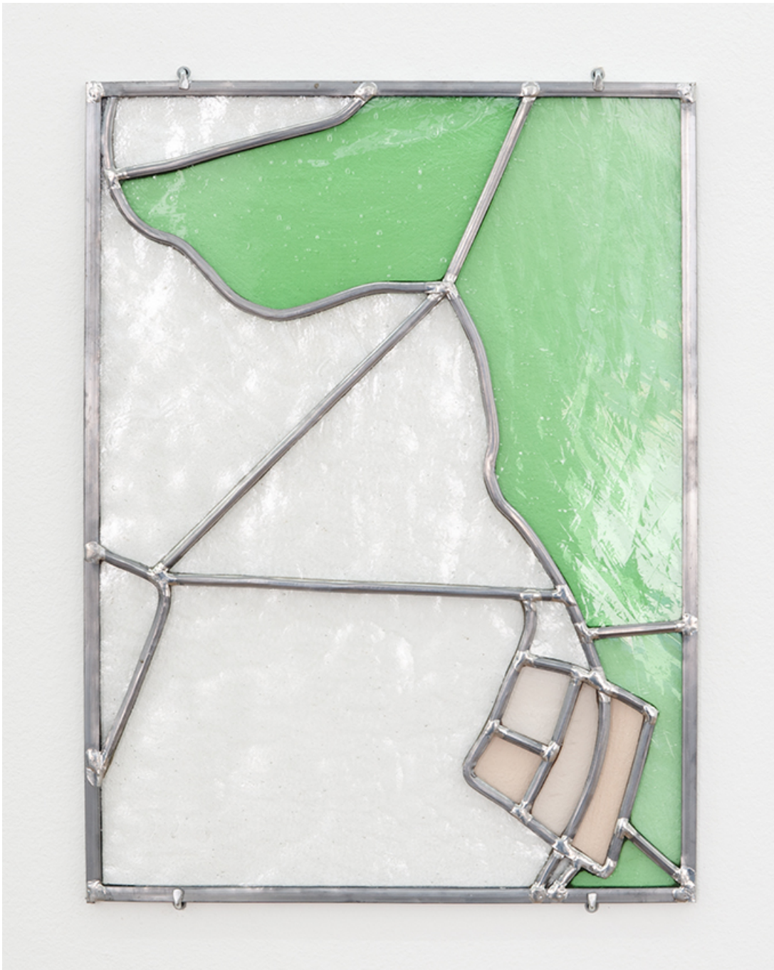
Parcelle 124-12, 2020 Vitrail (verre, zinc, plomb) 16.14 x 12.2 in ( 41,8 x 31 cm )