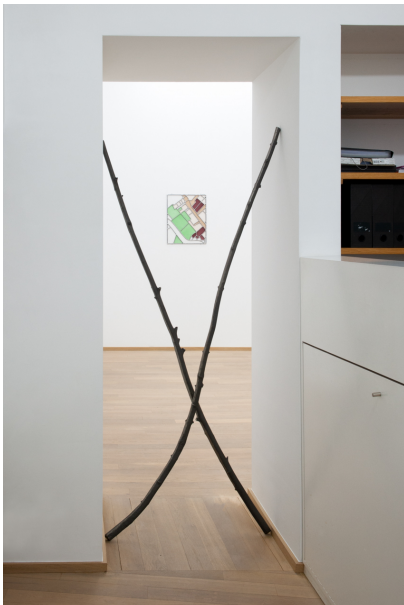
Prima Figlia Femmina Exhibition View Nosbaum Reding, Luxembourg, 2020