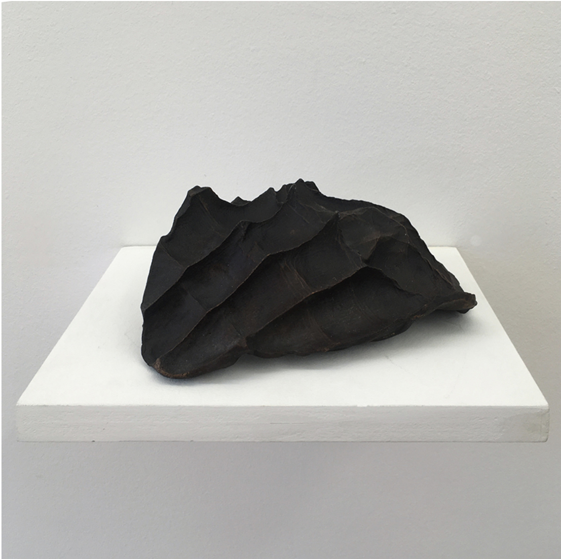
Contiens , 2017 Bronze 3.54 x 11.02 x 8.27 in ( 9 x 28 x 21 cm )