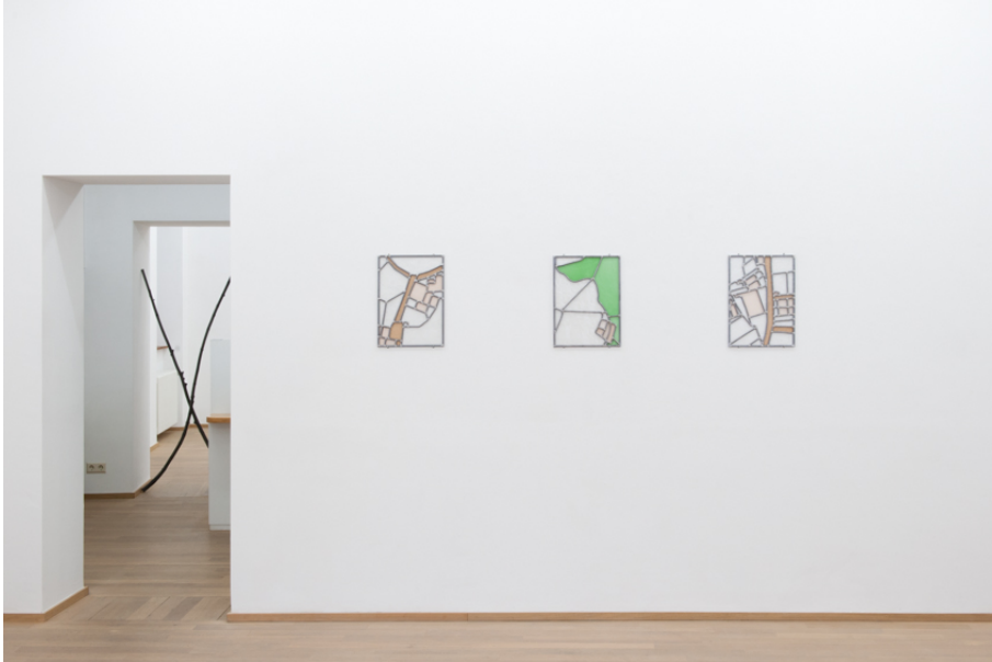
Prima Figlia Femmina Exhibition View Nosbaum Reding, Luxembourg, 2020