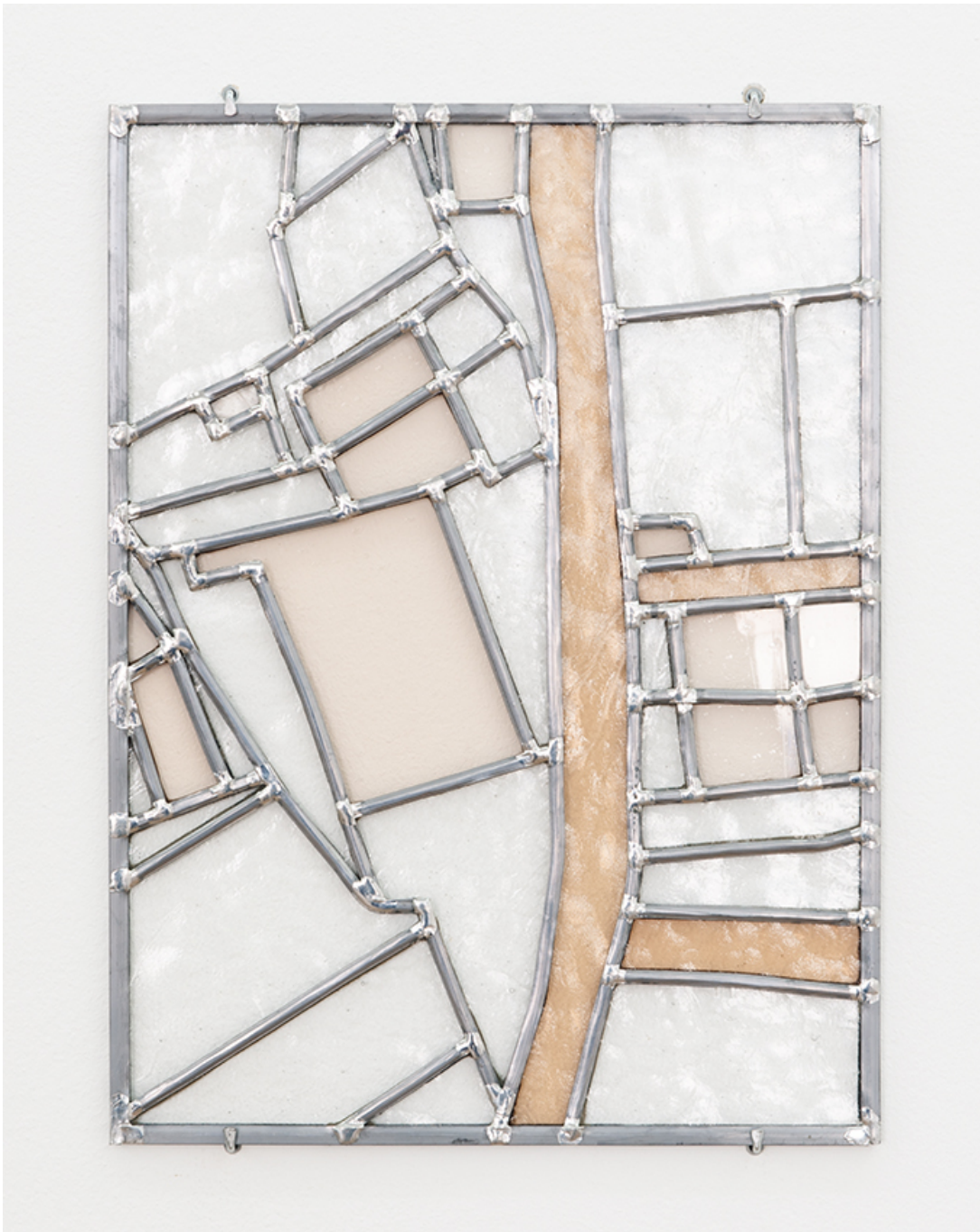
Parcelle 18-01-174, Aiale, 2020 Vitrail (verre, zinc, plomb) 16.14 x 12.2 in ( 41,8 x 31 cm )