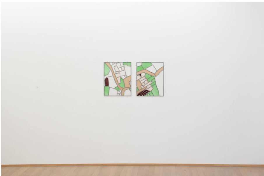
Prima Figlia Femmina Exhibition View Nosbaum Reding, Luxembourg, 2020