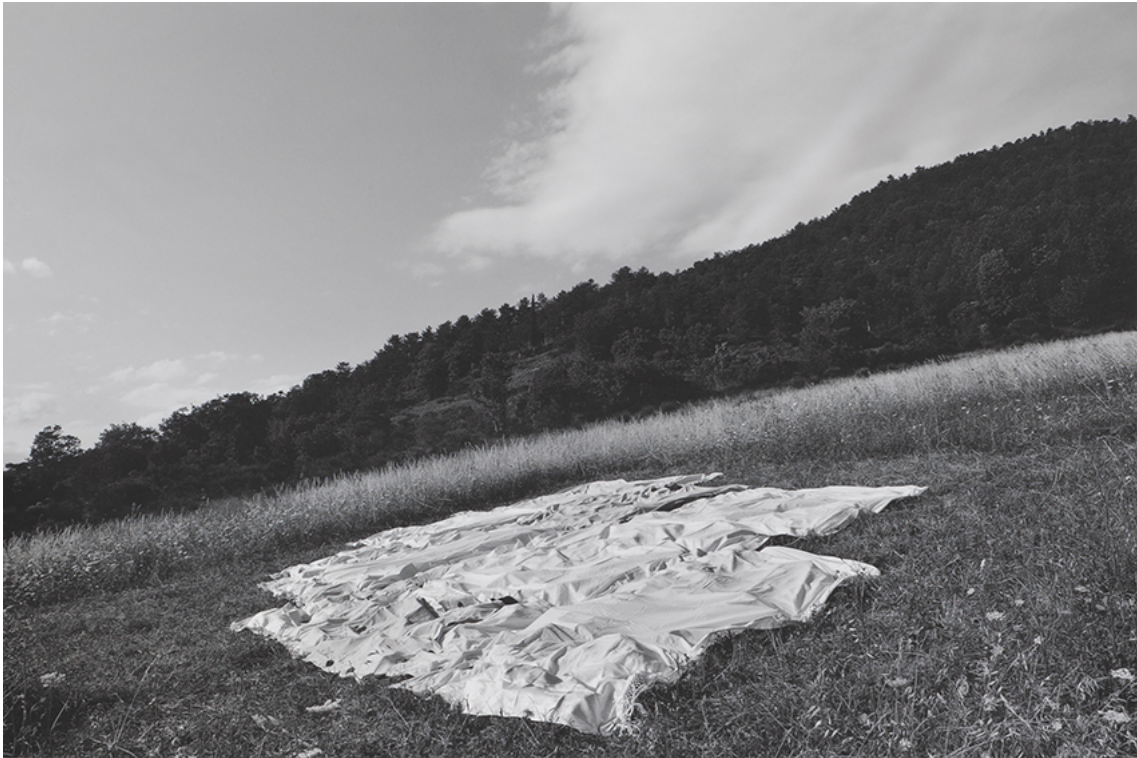
Campetto , 2019 Image : 23.23 x 35.04 in ( 59 x 89 cm )