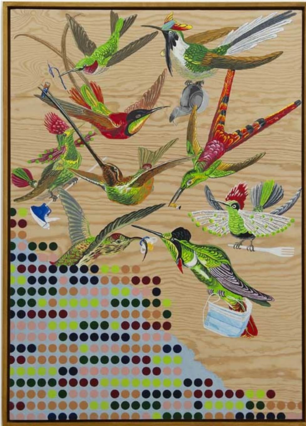
Ernst Haeckel de retour à Sainte-Lucie, 2020 Oil and acrylic on wood 46.85 x 33.07 in ( 119 x 84 cm )

Je ne peindrai plus de fleurs vu que l'homme a mangé la Terre