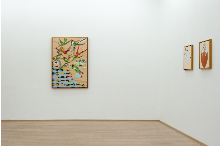
Je ne peindrai plus de fleurs vu que l'homme a mangé la Terre Exhibition View Nosbaum Reding, Luxembourg, 2020