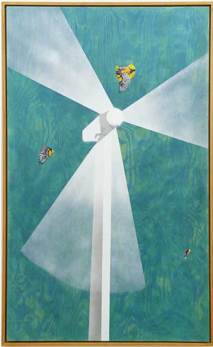
Dommage collatéral , 2019 Oil, acrylic and ink on wood 58.66 x 35.04 in ( 149 x 89 cm )

Je ne peindrai plus de fleurs vu que l'homme a mangé la Terre