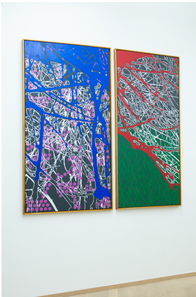
Je ne peindrai plus de fleurs vu que l'homme a mangé la Terre Exhibition View Nosbaum Reding, Luxembourg, 2020