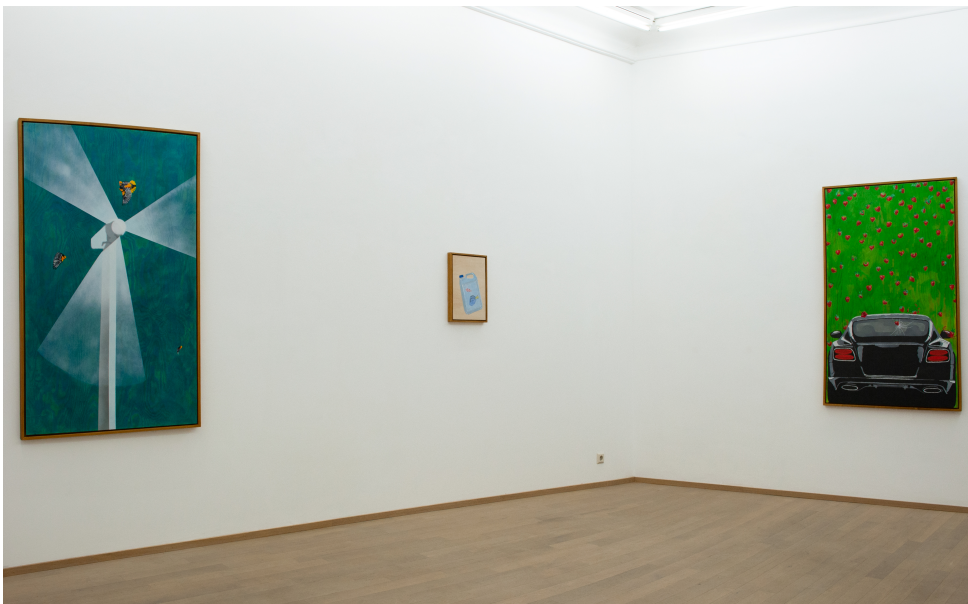
Je ne peindrai plus de fleurs vu que l'homme a mangé la Terre Exhibition View Nosbaum Reding, Luxembourg, 2020