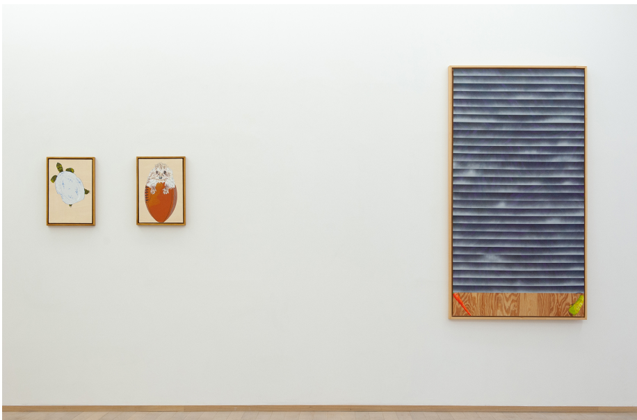
Je ne peindrai plus de fleurs vu que l'homme a mangé la Terre Exhibition View Nosbaum Reding, Luxembourg, 2020