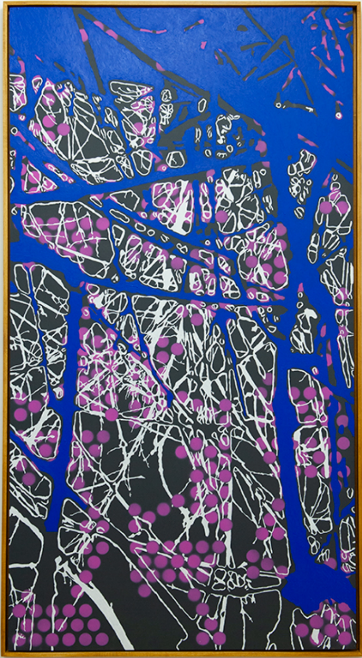
Les vendanges , 2018 Oil and acrylic on aluminium 59.06 x 31.5 in ( 150,5 x 80 cm )

Je ne peindrai plus de fleurs vu que l'homme a mangé la Terre