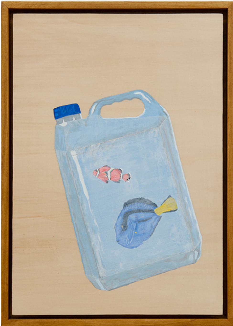
Santa Monica Bay , 2020 Oil, acrylique and ink on wood 16.14 x 11.02 in ( 41 x 28,5 cm )

Je ne peindrai plus de fleurs vu que l'homme a mangé la Terre