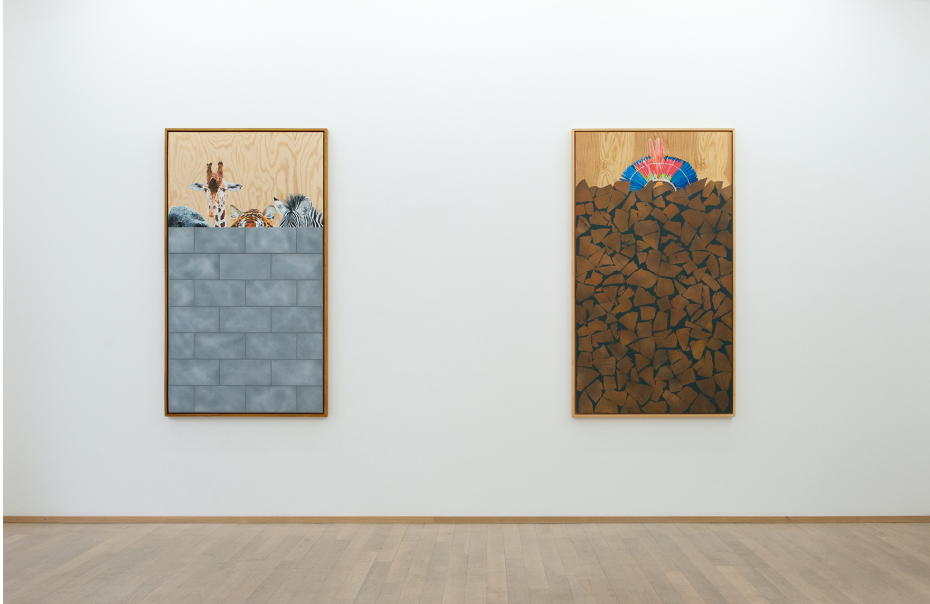
Je ne peindrai plus de fleurs vu que l'homme a mangé la Terre Exhibition View Nosbaum Reding, Luxembourg, 2020