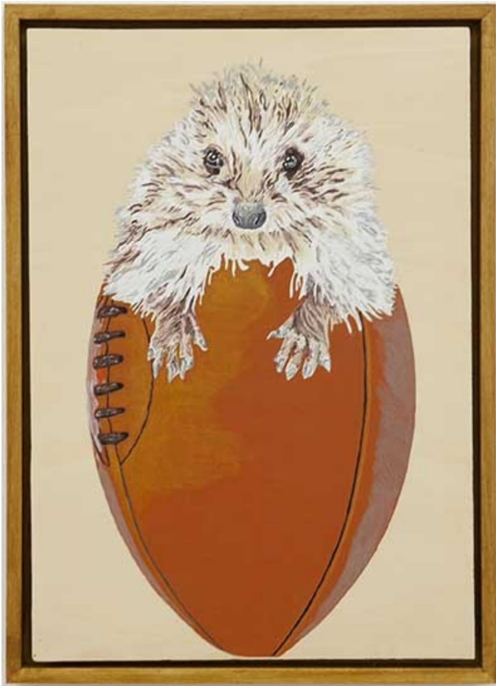
Eiris , 2020 Oil and acrylic on wood 16.14 x 11.02 in ( 41 x 28,5 cm )

Je ne peindrai plus de fleurs vu que l'homme a mangé la Terre