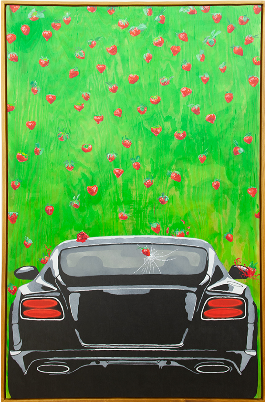
Plaie d'Egypte , 2020 Oil, acrylic and ink on wood 58.66 x 35.04 in ( 149 x 89 cm )

Je ne peindrai plus de fleurs vu que l'homme a mangé la Terre