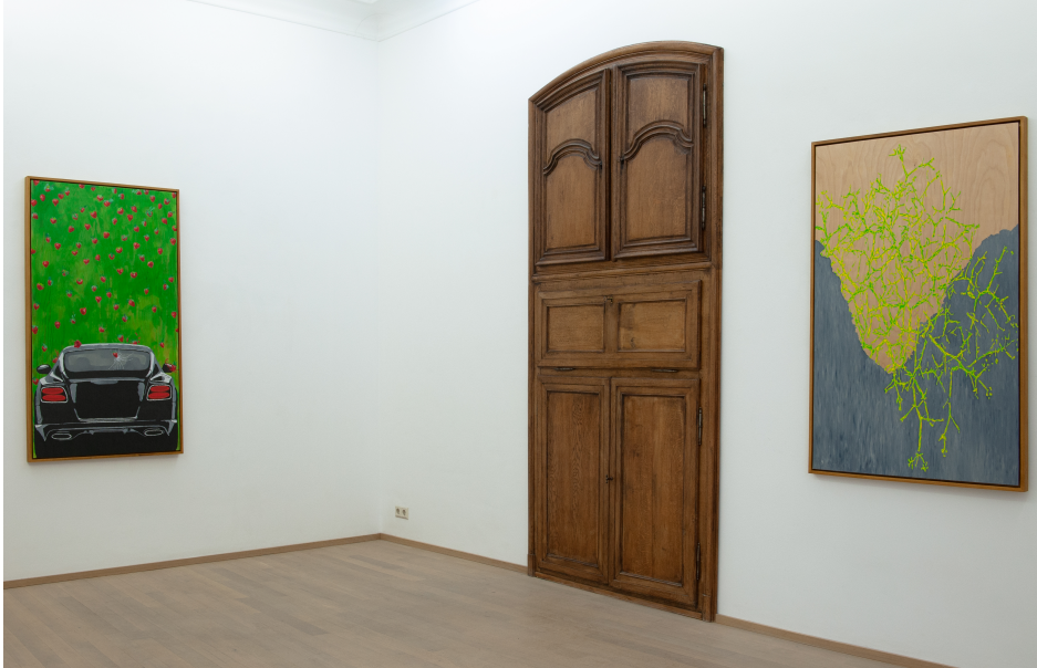
Je ne peindrai plus de fleurs vu que l'homme a mangé la Terre Exhibition View Nosbaum Reding, Luxembourg, 2020