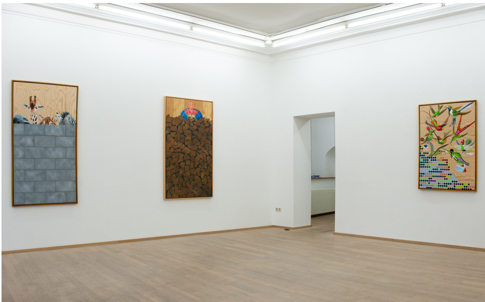
Je ne peindrai plus de fleurs vu que l'homme a mangé la Terre Exhibition View Nosbaum Reding, Luxembourg, 2020