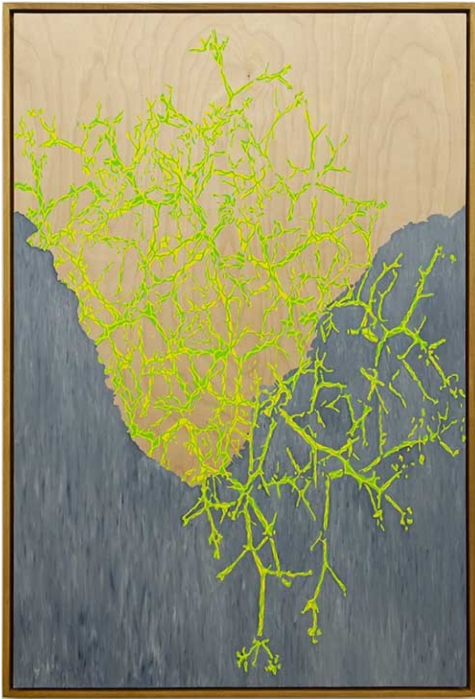
Virus-Virum-Vivarum , 2019 Oil, acrylic and ink on wood 52.76 x 35.04 in ( 134 x 89 cm )

Je ne peindrai plus de fleurs vu que l'homme a mangé la Terre