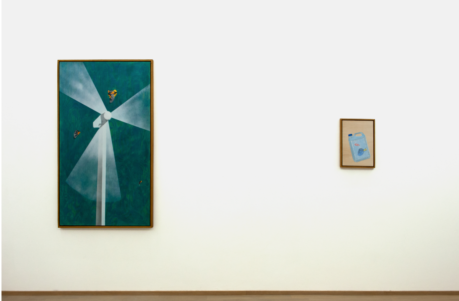
Je ne peindrai plus de fleurs vu que l'homme a mangé la Terre Exhibition View Nosbaum Reding, Luxembourg, 2020