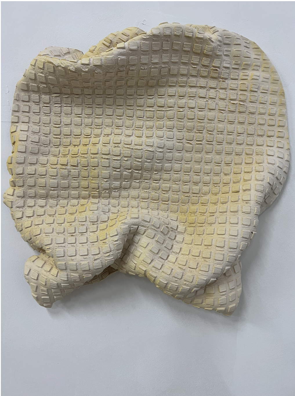
soft as a rock , 2022 Ceramic with slip 3.35 x 19.29 x 19.29 in ( 8.5 x 49 x 49 cm )