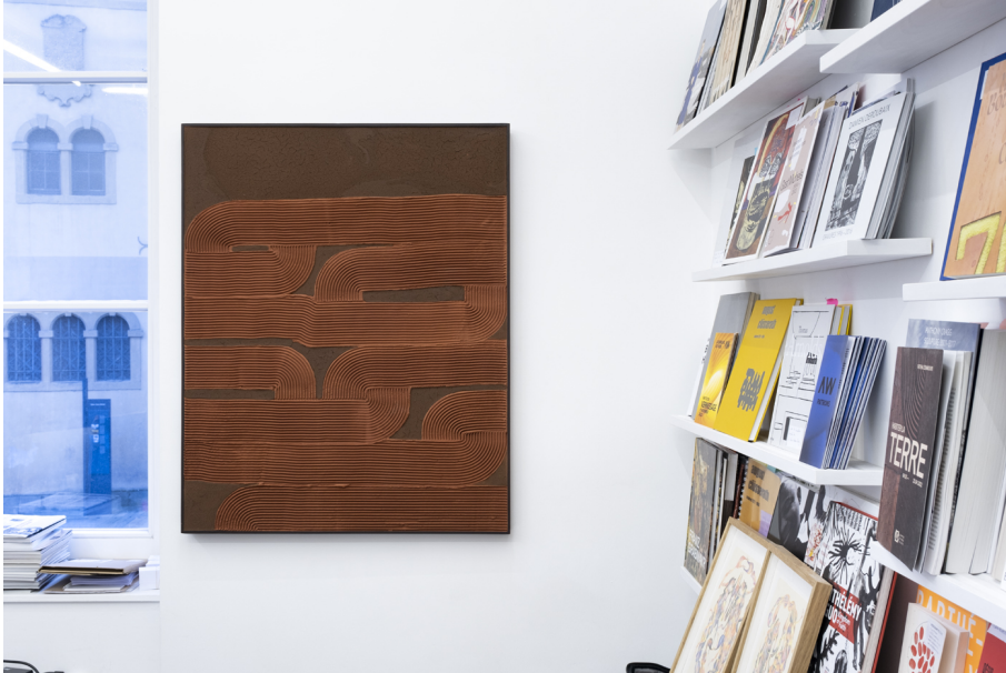
Hors-Sol Exhibition View Nosbaum Reding, Luxembourg, 2022