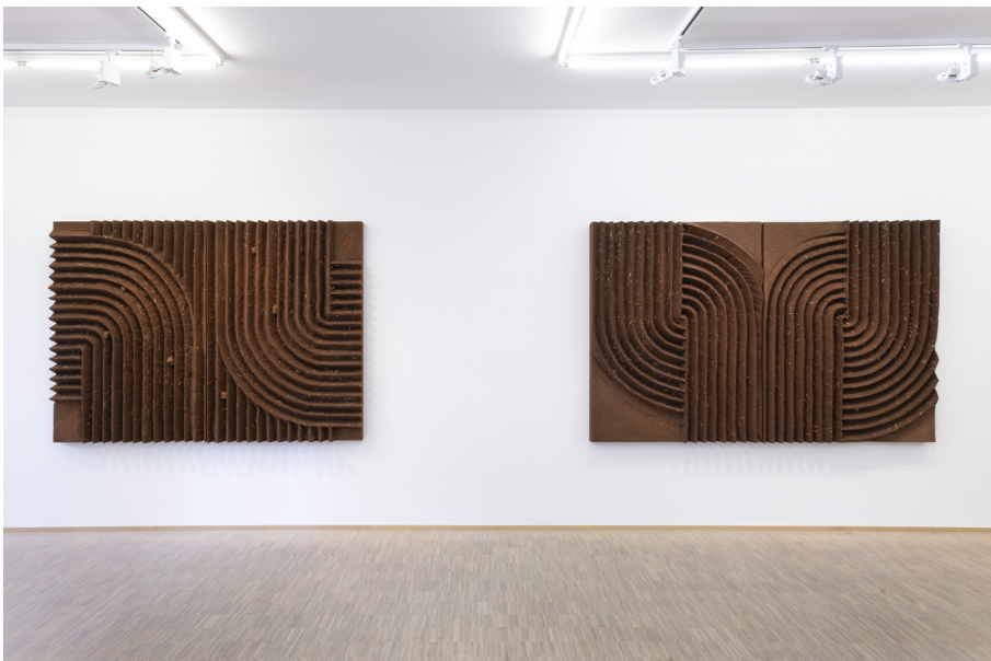
Hors-Sol Exhibition View Nosbaum Reding, Luxembourg, 2022