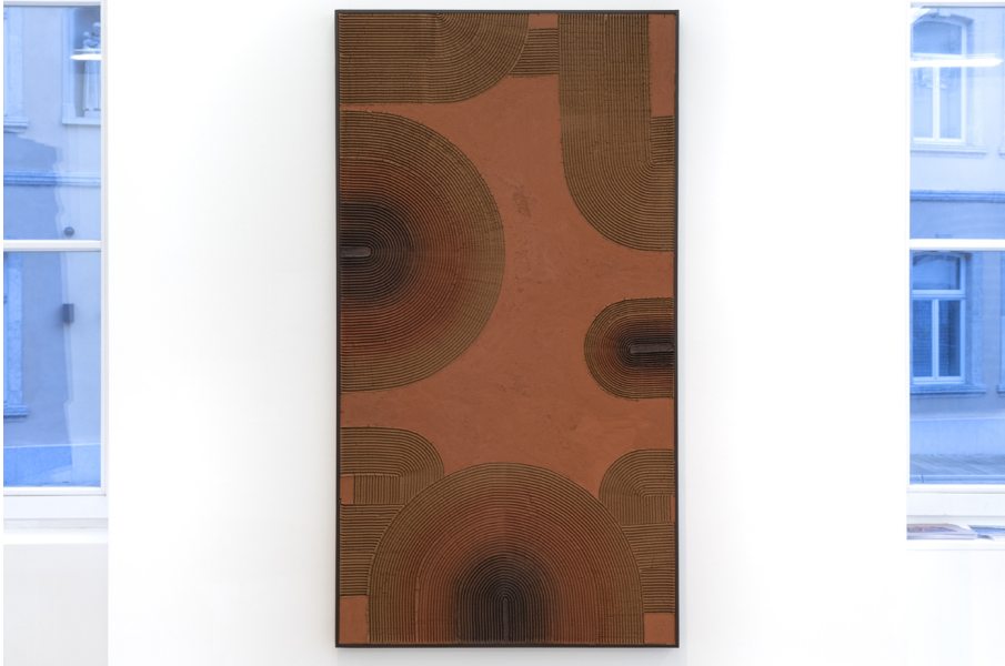
Hors-Sol Exhibition View Nosbaum Reding, Luxembourg, 2022