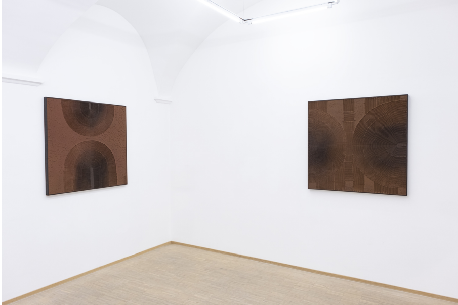
Hors-Sol Exhibition View Nosbaum Reding, Luxembourg, 2022