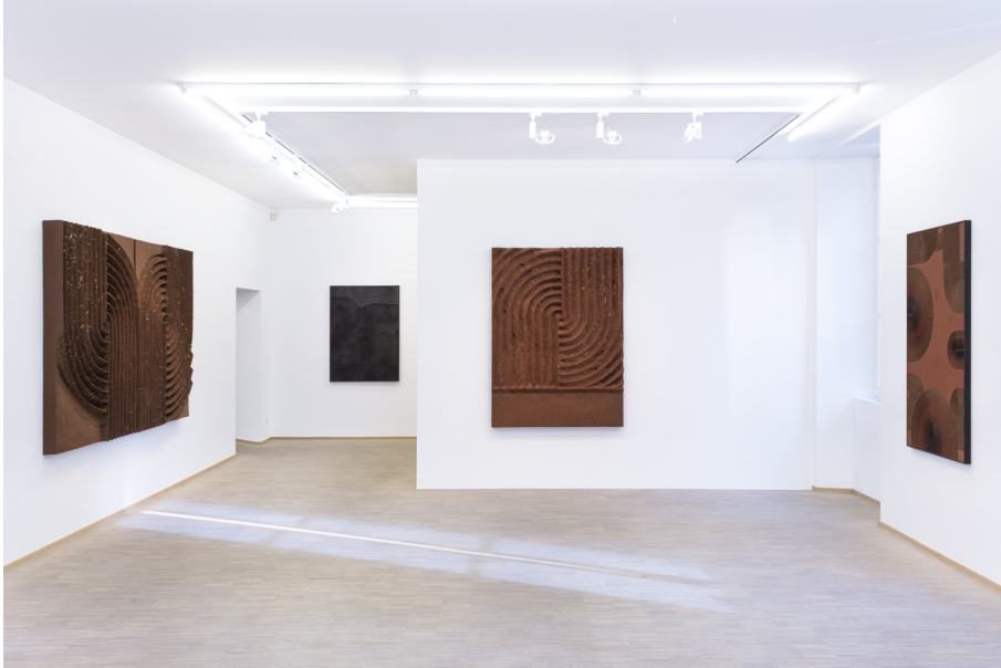
Hors-Sol Exhibition View Nosbaum Reding, Luxembourg, 2022