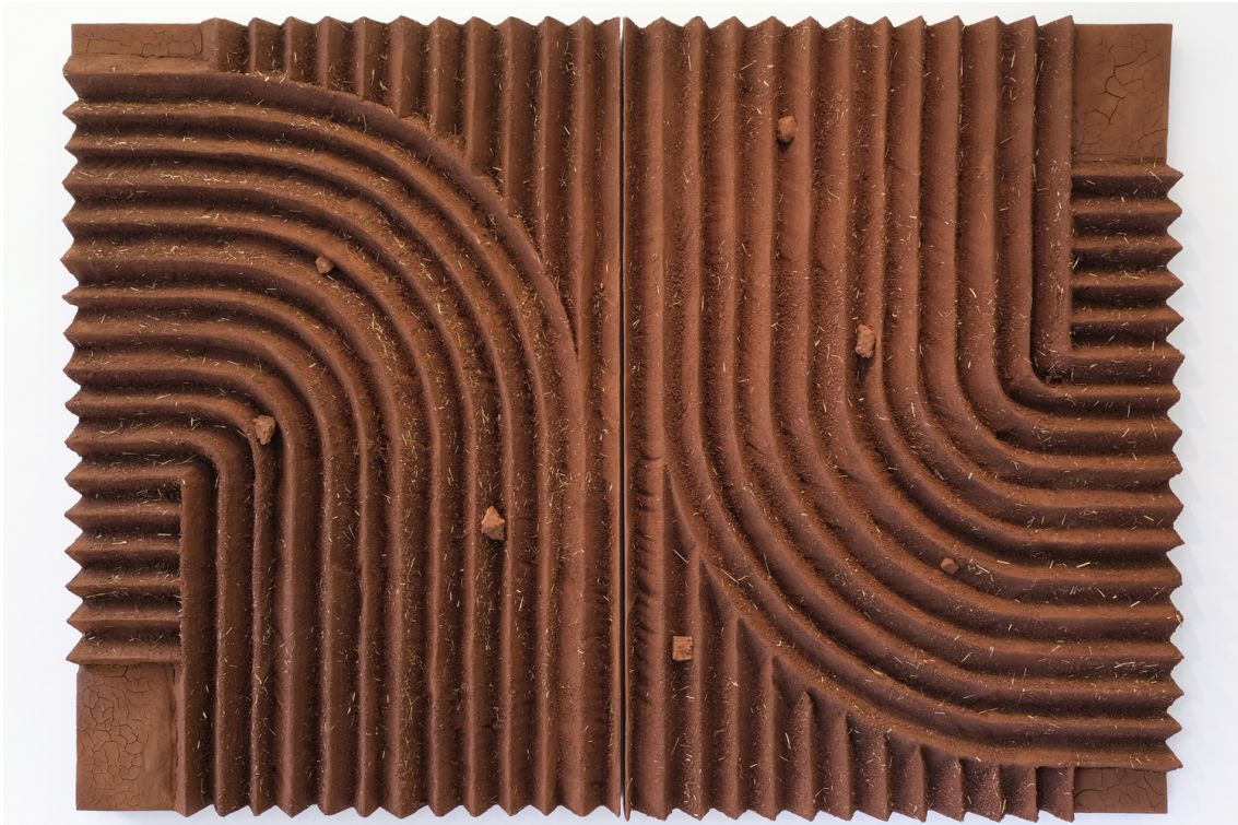
Intimité , 2022 Dyptique (162 x 112 cm) x 2 Earth, polyster and fibreglass on wood 63.78 x 88.19 in ( 162 x 224 cm )