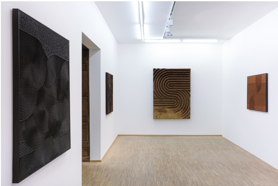
Hors-Sol Exhibition View Nosbaum Reding, Luxembourg, 2022