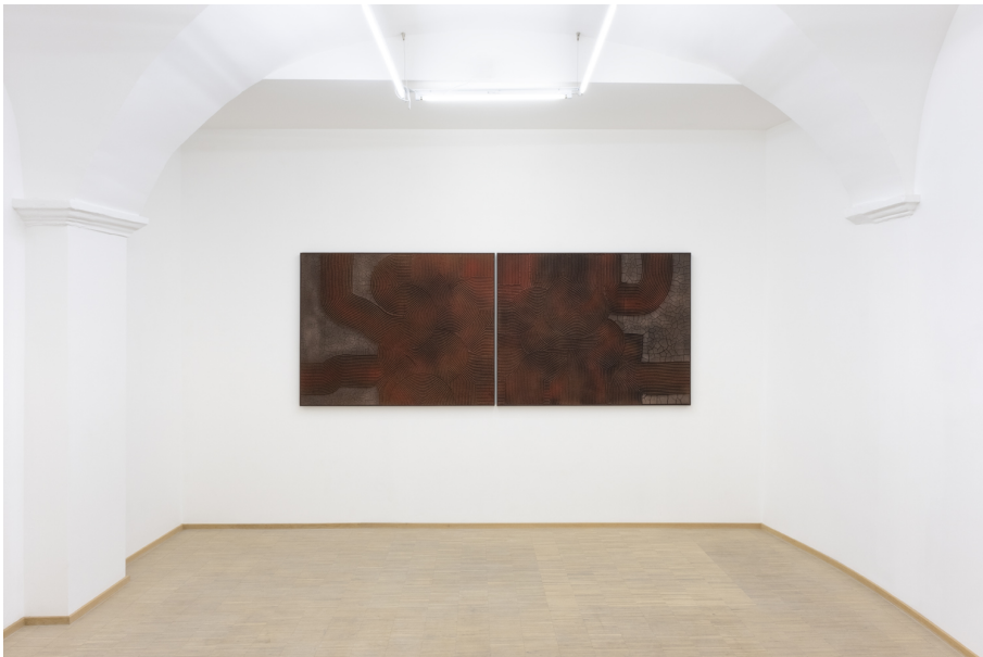
Hors-Sol Exhibition View Nosbaum Reding, Luxembourg, 2022