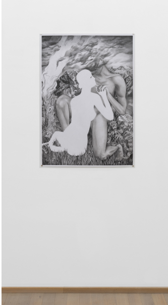
Amour, vous ne savez ce qu'est l'absence Exhibition View Nosbaum Reding, Luxembourg, 2023