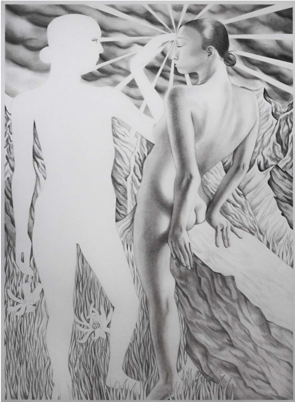
La lucidité est la blessure la plus rapprochée du soleil, 2023