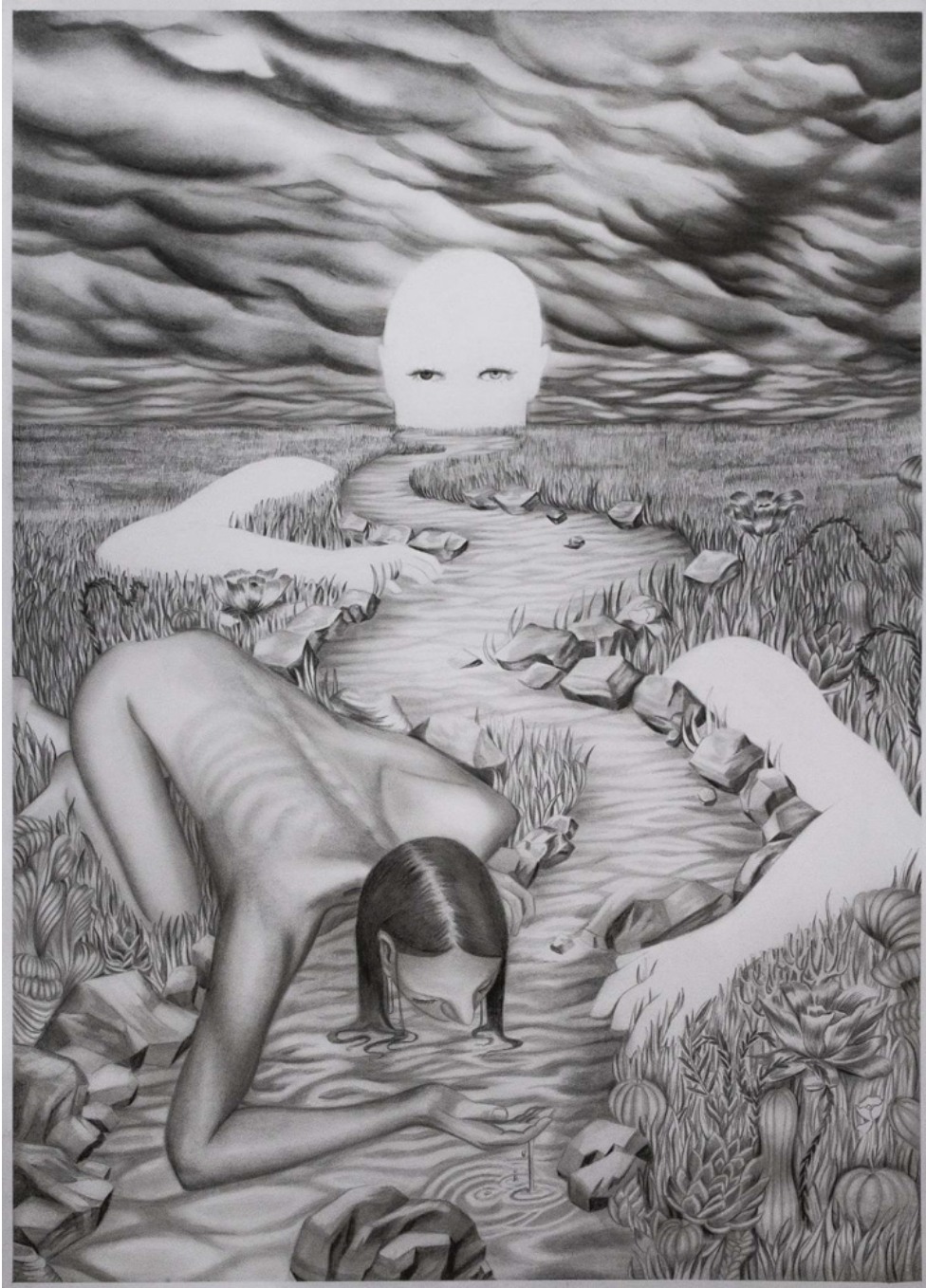
Le temple Vanisique, 2023 Fusain sur papier 39.37 x 27.56 in ( 100 x 70 cm )