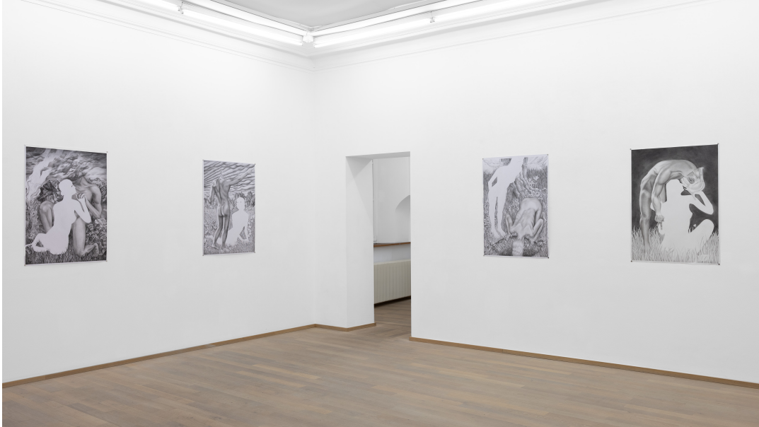
Amour, vous ne savez ce qu'est l'absence Exhibition View Nosbaum Reding, Luxembourg, 2023