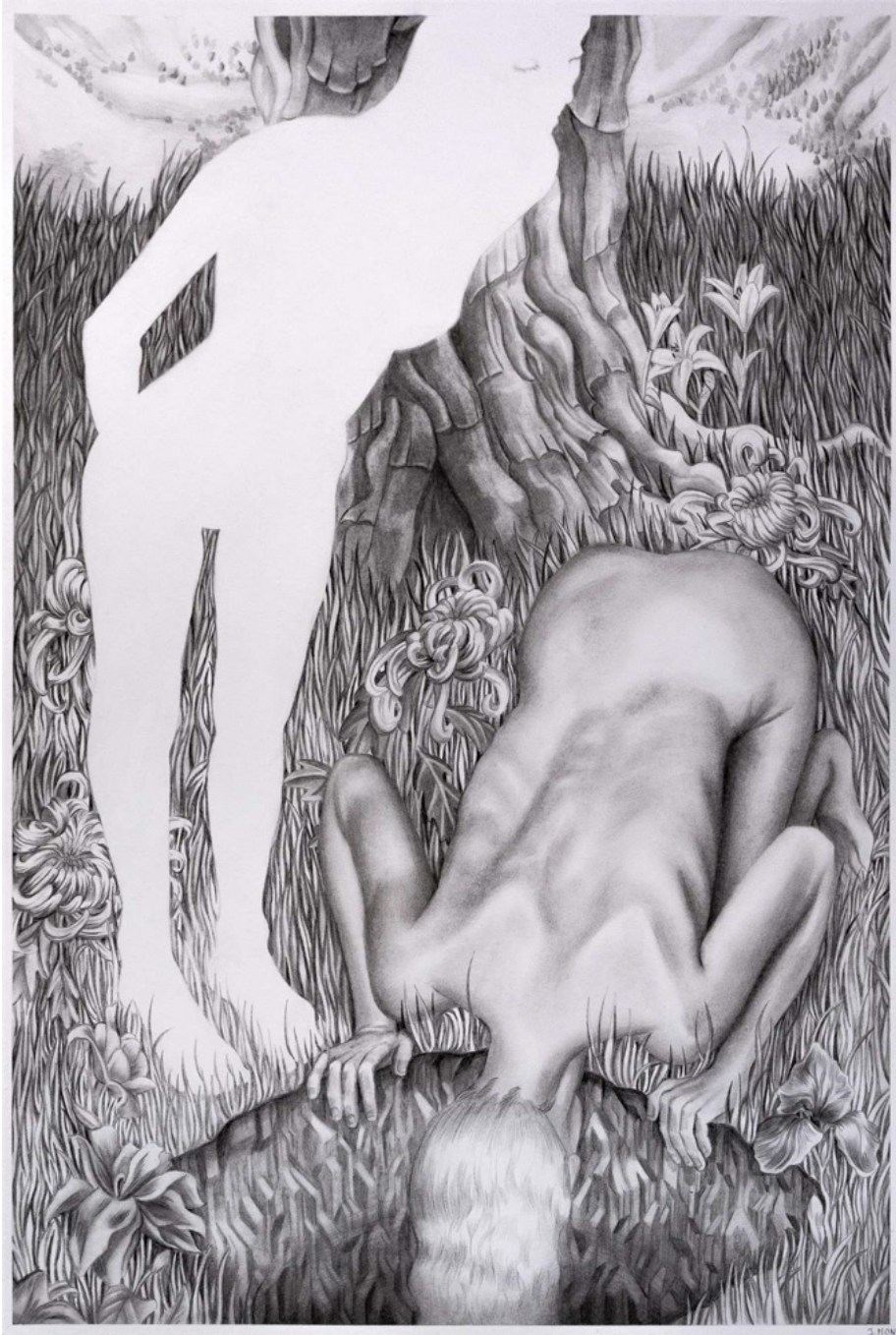
Entre le monde de la réalité et moi, il n'y a plus aujourd'hui d'épaisseur tristesse, 2023

Fusain sur papier 39.37 x 27.56 in ( 100 x 70 cm )