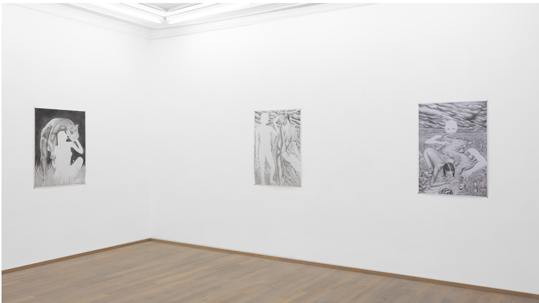
Amour, vous ne savez ce qu'est l'absence Exhibition View Nosbaum Reding, Luxembourg, 2023