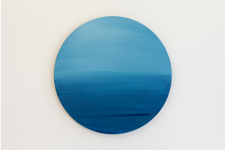
Nailing Colours to the Mast Exhibition View Nosbaum Reding, Luxembourg, 2024