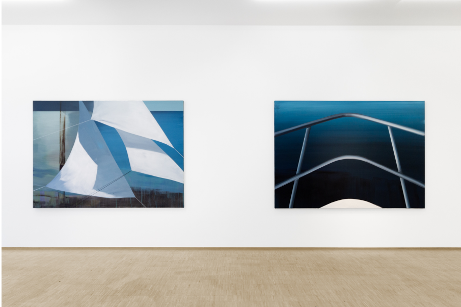
Nailing Colours to the Mast Exhibition View Nosbaum Reding, Luxembourg, 2024