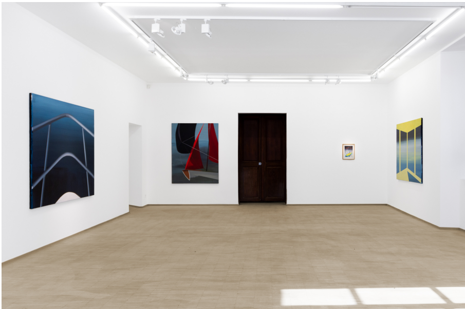
Nailing Colours to the Mast Exhibition View Nosbaum Reding, Luxembourg, 2024