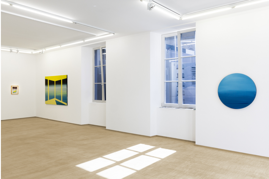
Nailing Colours to the Mast Exhibition View Nosbaum Reding, Luxembourg, 2024