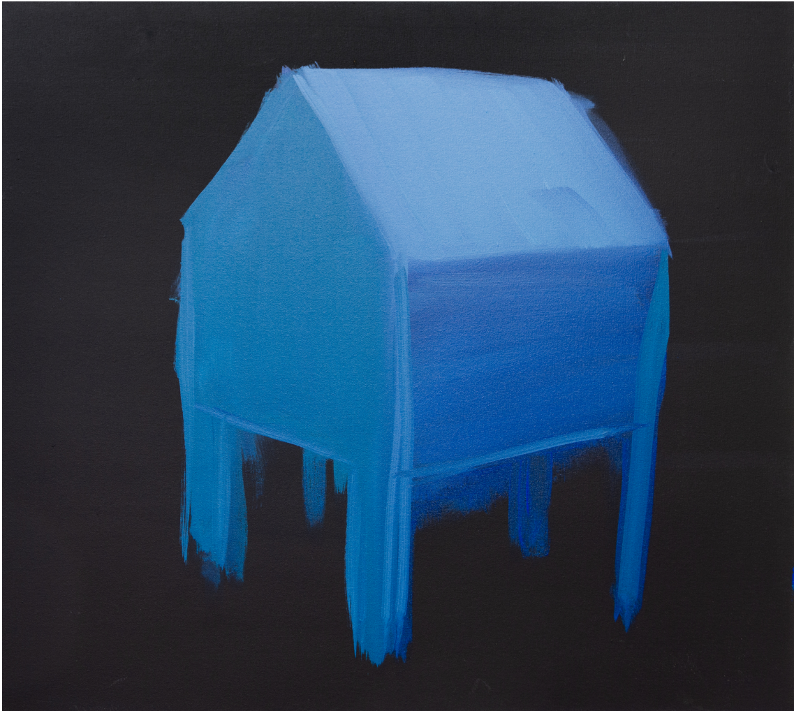
Melancholia , 2024 Acrylic on canvas 35.83 x 35.83 in ( 91 x 100 cm )