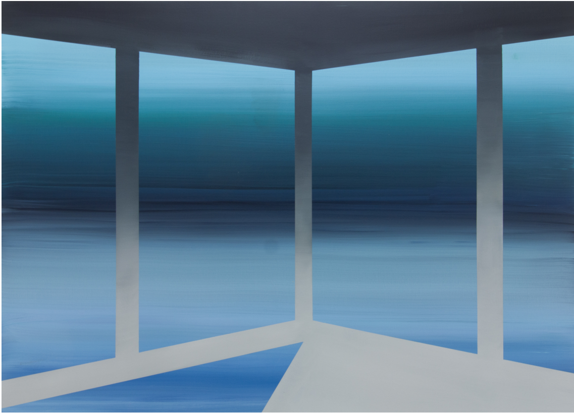
Zenne II , 2023 Acrylic on canvas 51.18 x 70.87 in ( 130 x 180 cm )