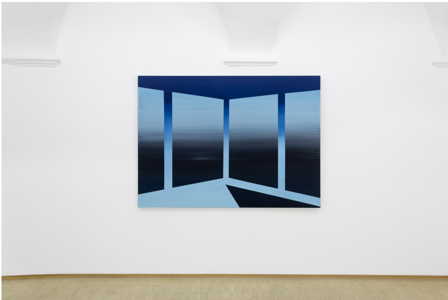
Nailing Colours to the Mast Exhibition View Nosbaum Reding, Luxembourg, 2024