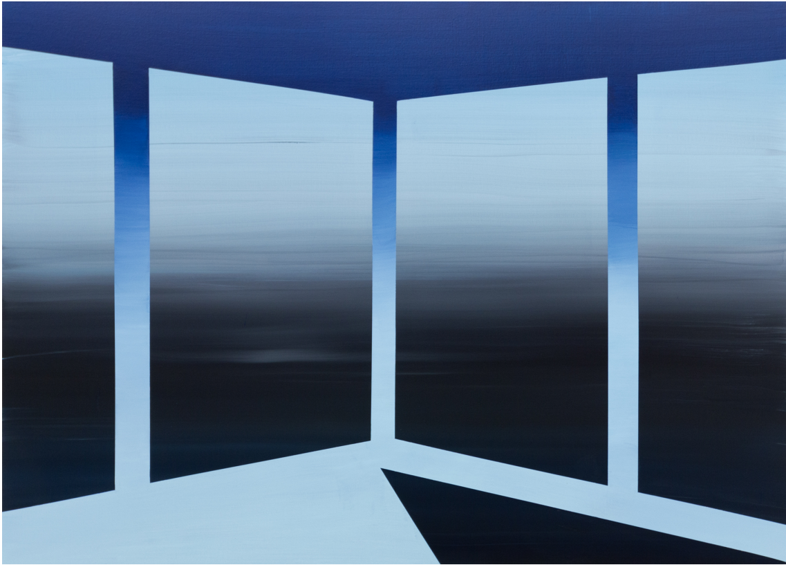
Zenne III , 2023 Acrylic on canvas 51.18 x 70.87 in ( 130 x 180 cm )