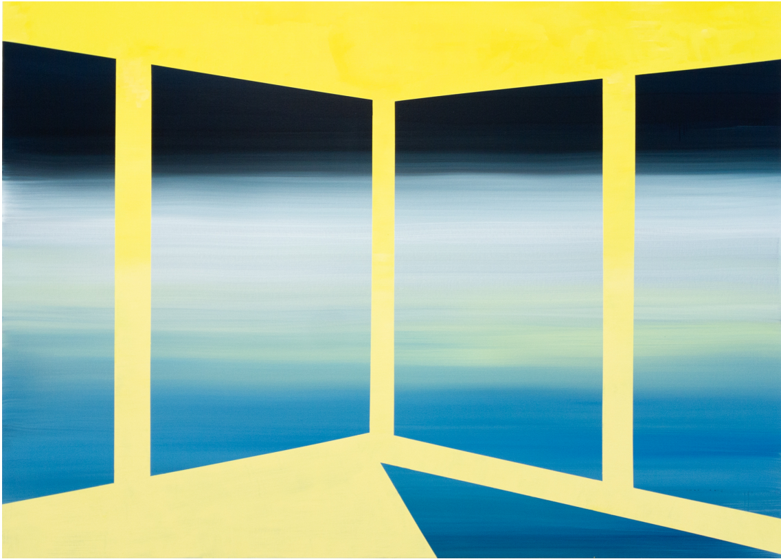
Zenne I , 2023 Acrylic on canvas 51.18 x 70.87 in ( 130 x 180 cm )