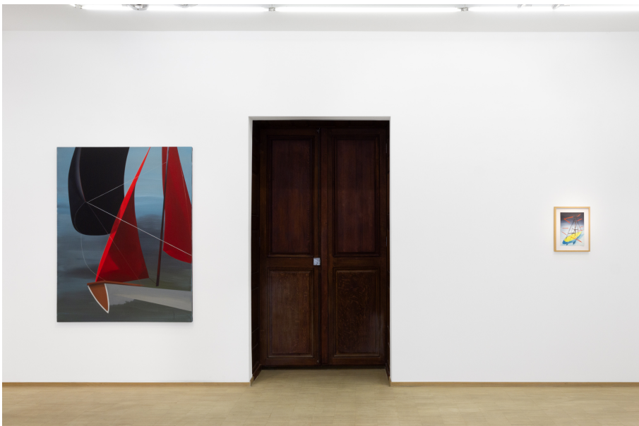
Nailing Colours to the Mast Exhibition View Nosbaum Reding, Luxembourg, 2024