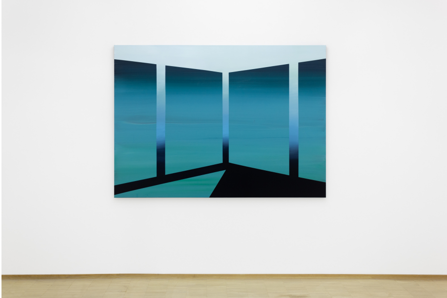
Nailing Colours to the Mast Exhibition View Nosbaum Reding, Luxembourg, 2024