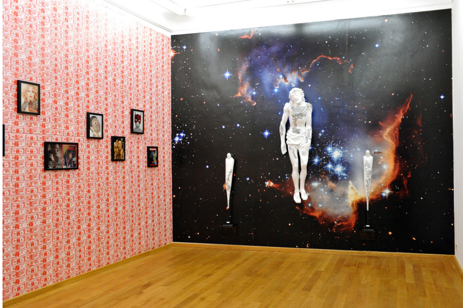
Transconnectionicons Exhibition View Nosbaum Reding, Luxembourg, 2010