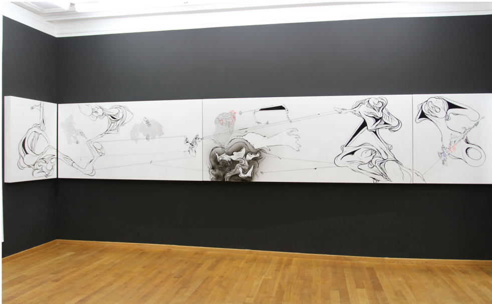
Transconnectionicons Exhibition View Nosbaum Reding, Luxembourg, 2010